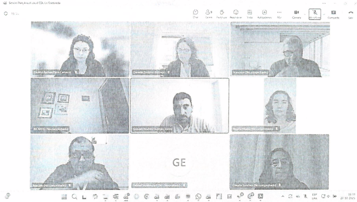
Paulina Parra Carrasco Ministra de fe